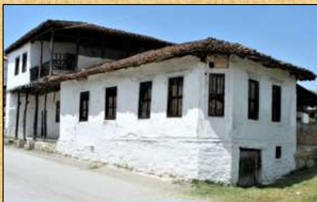
ΚΑΦΕΝΕΙΟ & ΧΑΝΙ Αρχική κατασκευή περί το 1905

Είχε πολύ καλές σχέσεις με τους συγχωριανούς του, ήταν αγαπητός. Βοηθούσε εκείνους τους κατοίκους του Χωριού που έκρινε ότι "δυσκολευόταν" οικονομικά.