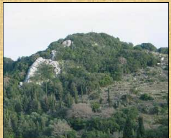
Ο λόφος "Κόντυλας" με την "Κορακόπετρα" στην "Περιοχή των Κορωνών"