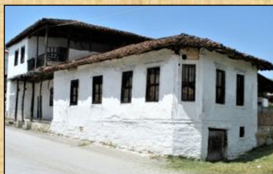
ΚΑΦΕΝΕΙΟ & ΧΑΝΙ Αρχική κατασκευή περί το 1905 ***** ΚΑΦΕΝΕΙΟ, ΠΑΝΤΟΠΩΛΕΙΟ & ΟΡΟΦΟΣ Μετά από διαρρύθμιση, επέκταση τη δεκαετία του 1930