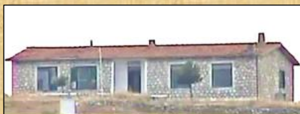
Ε.Φ. "Ω" (ανακατασκευασμένο 1967-1968)