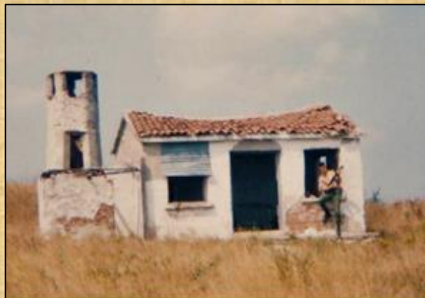
Εγκαταλειμμένο Ε.Φ. 612 Φωτογράφιση 1991 Tolis Zografos

Σημείωση 6 : Το 1955, έγινε ανέγερση Φυλακίου στη θέση "Καρακόπετρα" και ονομάστηκε "Ε.Φ. ΩΜΕΓΑ", οπότε σταμάτησε και η καθημερινή μετάβαση "σκοπών" από το Ε.Φ. 612.