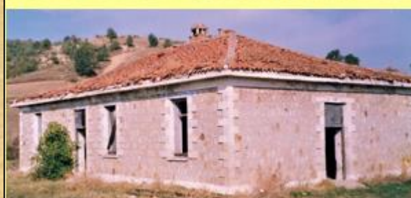
Κτίρια ΔΙΜΟΙΡΙΑΣ ΠΕΤΡΩΤΩΝ

Σημείωση 8 : Προς το τέλος της δεκαετίας του 1960, σε όλα τα ενεργεία φυλάκια έγινε "εκ βάθρων" ανακατασκευή.