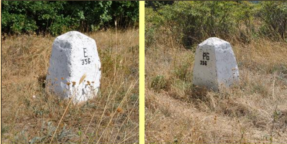
Οι δύο όψεις της Πυραμίδας 356