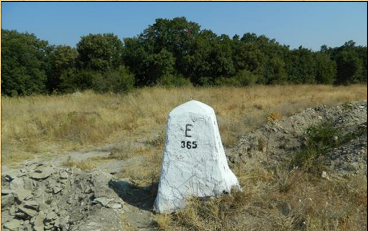
ΕΛΛΗΝΟ - ΒΟΥΛΓΑΡΙΚΑ ΣΥΝΟΡΑ , 2012

Το "Αυλάκι", που στην ουσία είναι και το "σύνορο", ήταν ένα απλό αυλάκι, που συντηρούνταν τακτικά, λόγω του μικρού βάθους του.