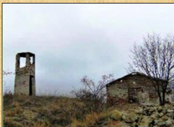
Εγκαταλειμμένο Ε.Φ. 612 με το Παρατηρητήριό του