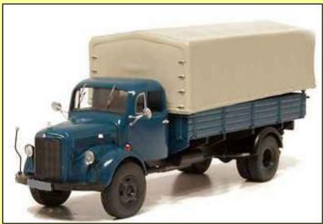
Μοντέλα φορτηγών που χρησιμοποιήθηκαν στον "Μύλο Πετρωτών"

Τα φορτηγά, ειδικά στα πρώτα χρόνια λειτουργίας τους, μαζί με τα είδη που μετέφεραν, μετέφεραν μερικές φορές και κατοίκους των άλλων Χωριών, Άνδρες και Γυναίκες, για να επιμεληθούν του αλέσματος ή της εκκοκκίσεως των βαμβακιών τους.