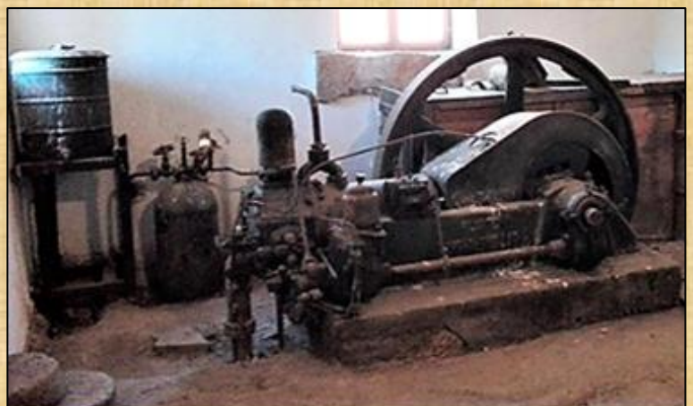
Μηχανή RUSTON στον Αλευρόμυλο ΠΕΤΡΩΤΩΝ

Περί το 1950, έγινε αντικατάσταση των παλαιών μηχανών που έδιναν κίνηση στις "πέτρες", με νέα πετρελαιοκίνητη μηχανή, της Αγγλικής εταιρείας "RUSTON", 44 HP (Ίππων).