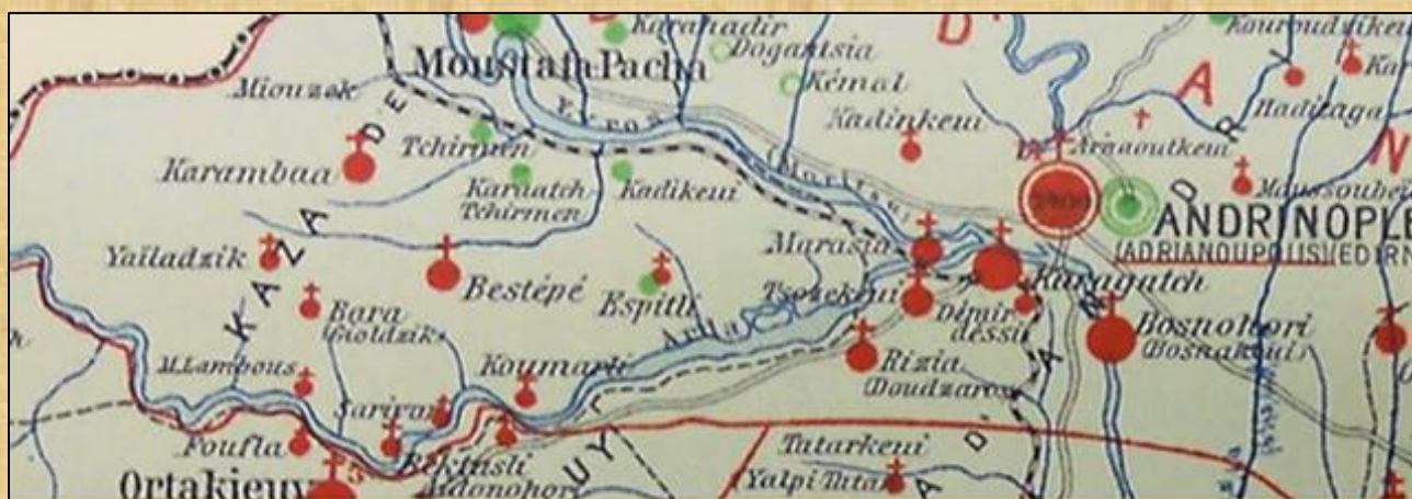
Απόκομμα από Λιθόγραφο Εθνογραφικό χάρτη, έκδοσης 1908

Οι κάτοικοι του Χωριού, ειδικά οι παλαιοί, το Χωριό, ακόμη και μετά από 40-50 χρόνια από την απελευθέρωση, το αποκαλούσαν στην καθομιλουμένη “Καράμπαη”.