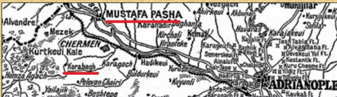
MUSTAFA PASHA και Karabagh , από επιλεγμένο απόκομμα Χάρτη του 1912

Η ονομασία του Χωριού, ως “Καράμπαγη”, καθιερώθηκε και έγινε αποδεκτή από τους Οθωμανούς, αφού και σε μερικούς χάρτες εμφανίζεται και ως Karabağh”.