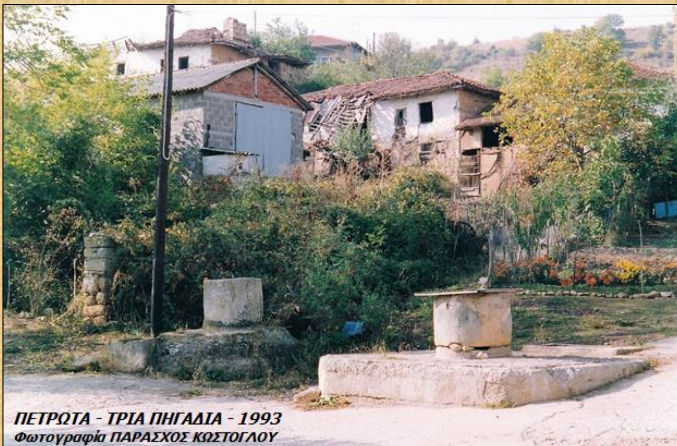
ΠΕΤΡΩΤΑ - ΤΡΙΑ ΠΗΓΑΔΙΑ - 1993

Σημείωση: Η "Προσωπική εργασία" ήταν ένας θεσμός που είχε καθιερωθεί από τα προπολεμικά χρόνια και συνεχίστηκε για μερικές δεκαετίες και μετά την λήξη των Πολέμων.