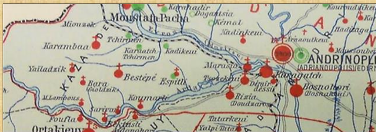
Απόκομμα από Λιθόγραφο Εθνογραφικό χάρτη, έκδοσης 1908

Σε όλα αυτά τα χρόνια, οι κάτοικοι των γειτονικών Χωριών, την "Καράμπαη" την αποκαλούσαν "Καράμπαα".