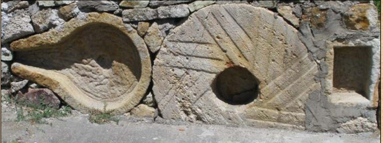
Μεταχειρισμένα Προϊόντα επεξεργασμένης πέτρας, σε πέτρινη κατασκευή, μετά την ολοκλήρωση του κύκλου ζωής του αρχικού σκοπού κατασκευής τους

Τελευταία πώληση πραγματοποιήθηκε το 1963.