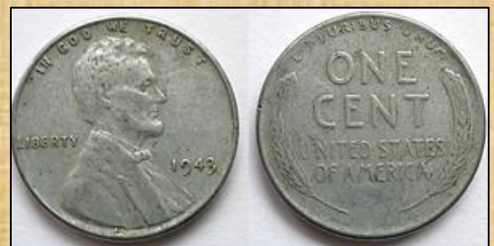
1 Σέντ Αμερικής, έκδοσης 1943