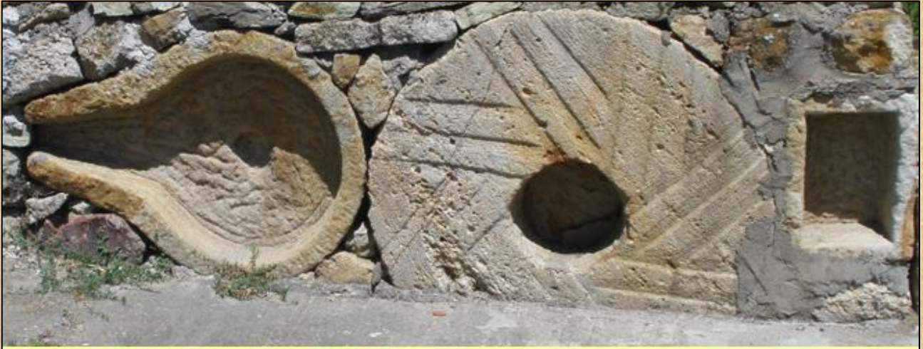
Μεταχειρισμένα Προϊόντα επεξεργασμένης πέτρας, σε πέτρινη κατασκευή, μετά την ολοκλήρωση του κύκλου ζωής του αρχικού σκοπού κατασκευής τους