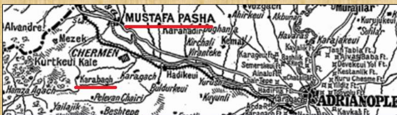
MUSTAFA PASHA και Karabagh, από επιλεγμένο απόκομμα Χάρτη του 1912

Η ονομασία του Χωριού, ως "Καράμπαη", καθιερώθηκε και έγινε αποδεκτή από τους Οθωμανούς, αφού και σε μερικούς χάρτες εμφανίζεται και ως Karabağh".