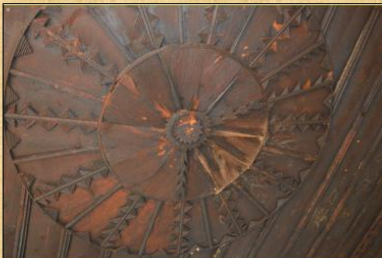
Διακοσμημένο ξύλινο ταβάνι στο Καφενείο του ΜΕΡΙΚΙΔΗ ΑΔΑΜ Λεπτομέρεια: 2 πυροβολισμοί από Βουλγάρικο όπλο, άφησαν τα σημάδια τους, για να θυμίζουν δύσκολες εποχές για την Οικογένεια ΜΕΡΙΚΙΔΗ

διαφορετικά θα ανέφερε τις πληροφορίες αυτές στους ανωτέρους του και επιγραμματικά με έντονο ύφος τον ενημέρωσε ότι η τιμωρία σε αυτή την περίπτωση είναι η ποινή του Θανάτου. Ο Αδάμ Μερικίδης, βεβαίως αρνήθηκε και από εκείνη την ημέρα ξεκίνησε το δράμα του.