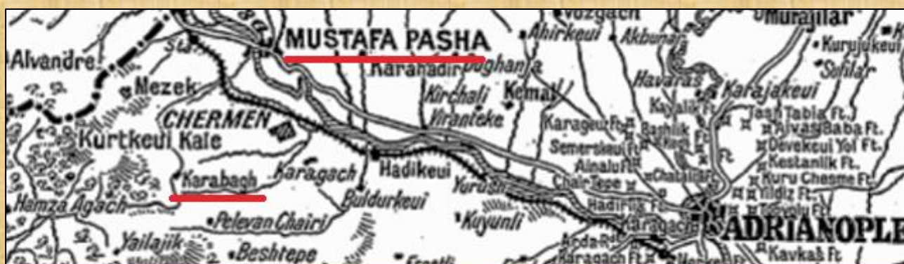
MUSTAFA PASHA και Karabagh, από επιλεγμένο απόκομμα Χάρτη του 1912

Με την πάροδο του χρόνου και επειδή οι κάτοικοι της περιοχής μιλούσαν την Ελληνική γλώσσα, στο όνομα πρόσθεσαν το Ελληνικό ουδέτερο άρθρο “το” και το Χωριό πλέον το αποκαλούσαν “Το Χωριό Καράμπαγ”.