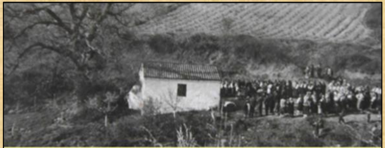
Παρασκευή, 30 Απριλίου 1954

Η πρώτη, μετά την ανακατασκευή, “Θεία λειτουργία” στο Παρεκκλήσι, έγινε την Παρασκευή 30 Απριλίου 1954, εορτή της “Ζωοδόχου Πηγής”.