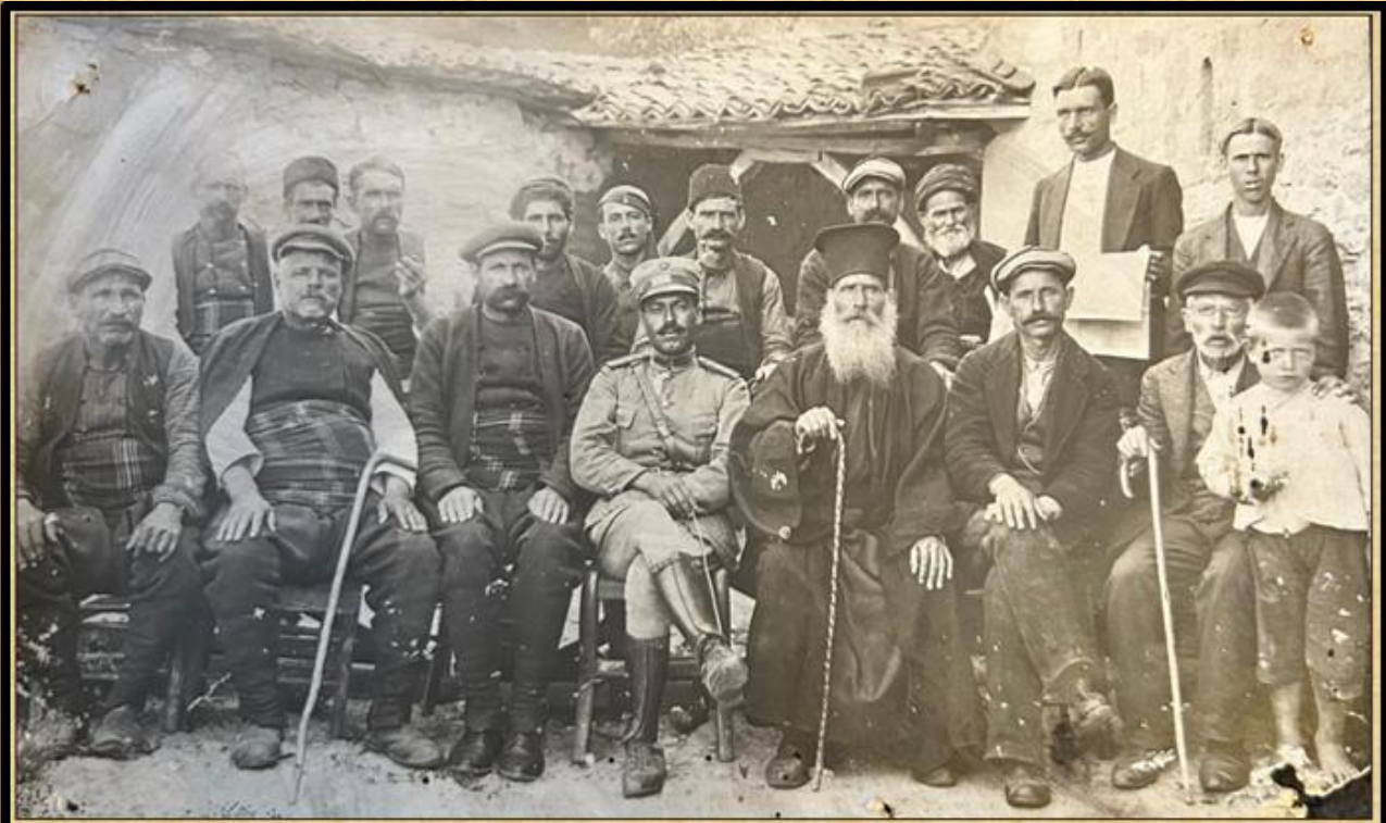
Αναμνηστική φωτογράφιση κατά την απελευθέρωση των ΠΕΤΡΩΤΩΝ

Στην πανηγυρική ατμόσφαιρα που δημιουργήθηκε, ακολούθησε και η σχετική αναμνηστική φωτογράφιση του Συνταγματάρχη με τους επιφανείς του Χωριού μπροστά στο τότε κτίριο της Κοινότητας του Χωριού.