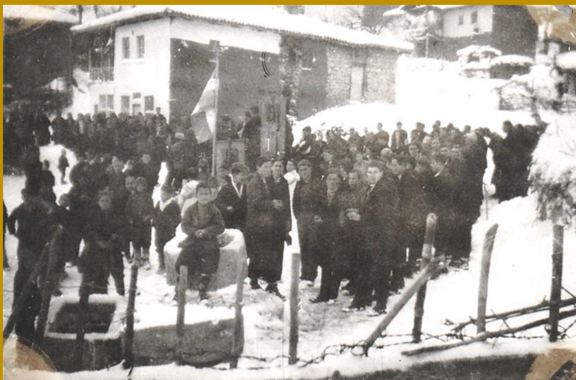
ΤΡΙΑ ΠΗΓΑΔΙΑ – ΘΕΟΦΑΝΕΙΑ 1947

"Εν Ιορδάνη βαπτιζομένου σου Κύριε. . .", ευλογούσε και μοίραζε "Αγιασμό" στους παρευρισκόμενους για τα σπίτια τους.